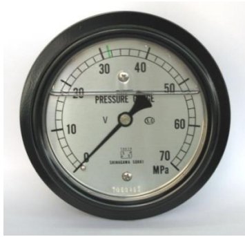
油圧系統用 70MPa 圧力計